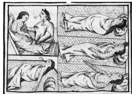
16世紀のメキシコの天然痘感染者